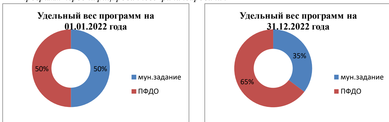
Диаграмма 5. Удельный вес программ в рамках реализации муниципального задания и программ персонифицированного финансирования

Сравнительная характеристика удельного веса программ и количества обучающихся по программам в рамках реализации муниципального задания и программ персонифицированного финансирования в 2022 году представлена в диаграммах 5-6.